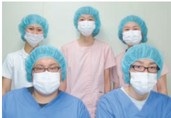
胚培養士が、大切な胚を管理します。最新技術により胚盤胞の高い発育率を目指しています。