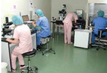
採卵室と培養室には衛生面に配慮したエアフィルターを設置し、充実の不妊治療機器を完備しています。