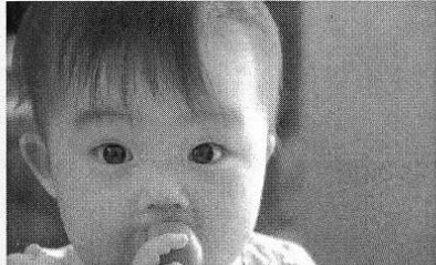
静岡県、静岡市、浜松市では、高額の不妊治療に要した費用の一部を助成する「特定不妊治療費助成事業」を実施しています。

自然周期治療では、育った1つの卵子が排卵し、卵管で精子と受精して成長しながら子宮に移動して内膜に着床します。女性側にきちんと生理周期があつて卵子が育つていれば、その自然に育つている卵子を使って治療するのが、女性の体に負担のからないうえに、自然に育つてきた卵子の質がよくなるというメリットがあります。